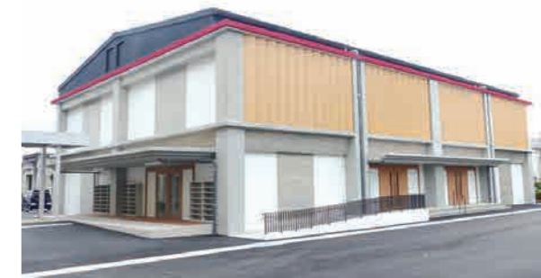
中学校体育館（冷暖房完備）

■多様性に富む国際社会の発展や、よりよい地域社会の創生に貢献できる人材を育成します。さまざまな課題に主体的に挑戦し、他者と協働しながら、グローバルな視点をもって行動できる力を養います。